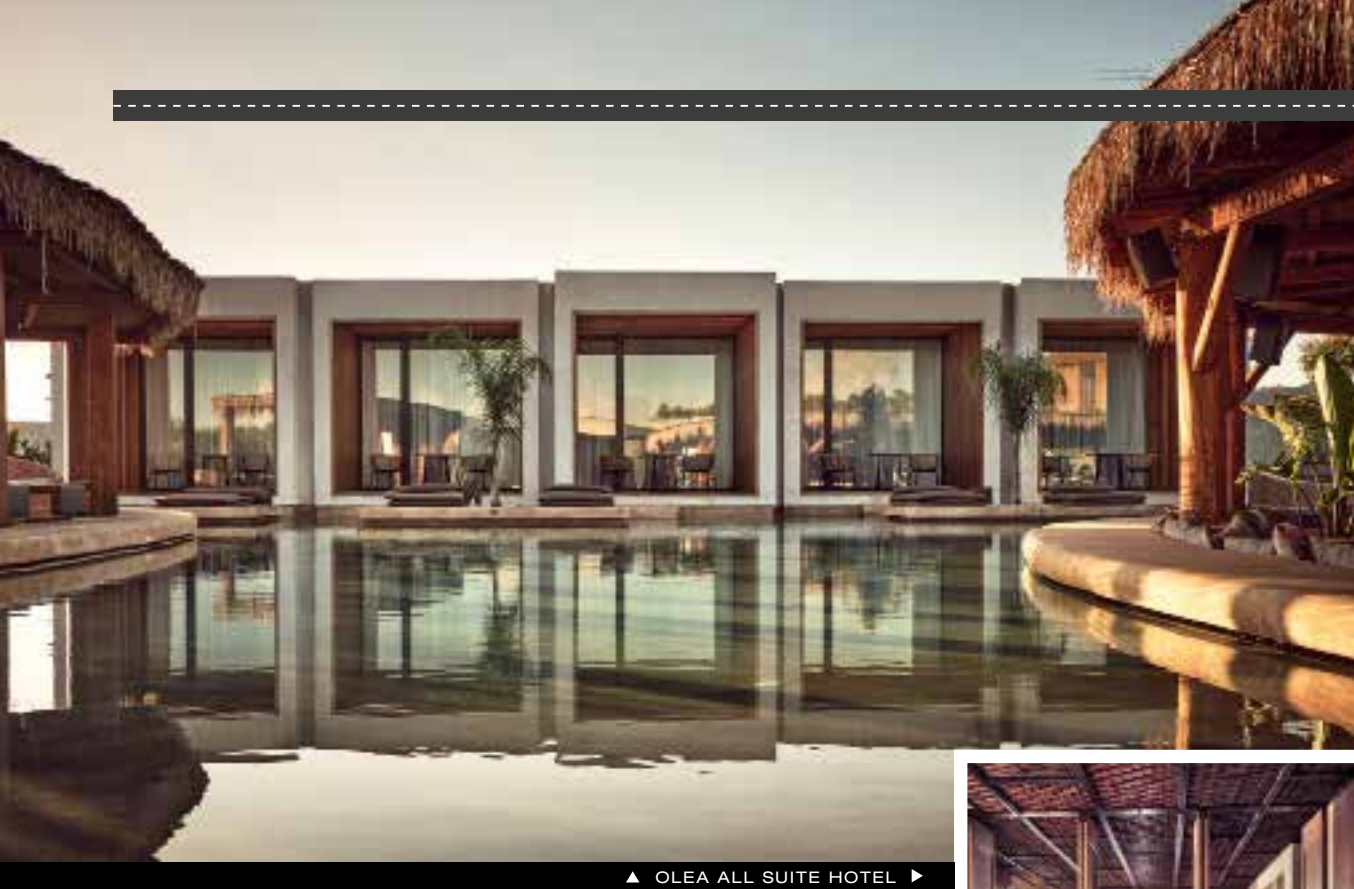
▲ OLEA ALL SUITE HOTEL ▶