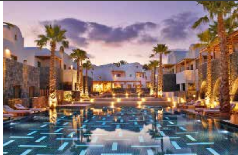
▲ RADISSON BLU ZAFFRON RESORT ▼

dell'isola questo hotel sulla costa sudorientale di Santorini. Ha 103 camere e suite oltre a ville esclusive a due piani, che traggono ispirazione dall'architettura imbiancata a calce delle Cicladi, con pareti bianche e mobili di legno chiaro. Il cuore del resort sono due grandi piscine con 80 lettini e un bar dove gustare sushi e