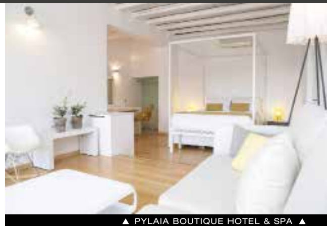
▲ PYLAIA BOUTIQUE HOTEL & SPA ▲