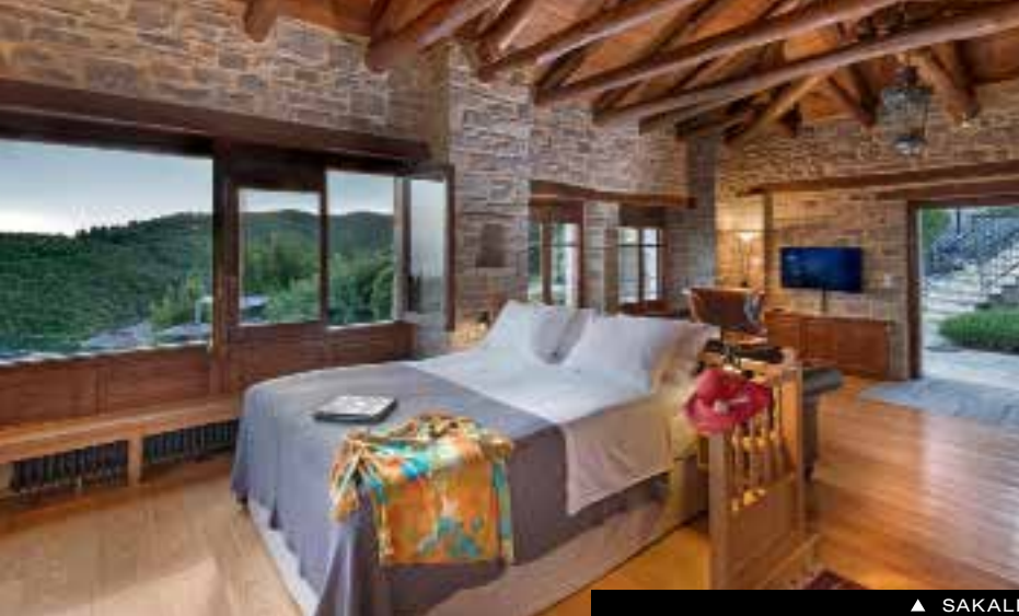
▲ SAKALI MANSION ▲