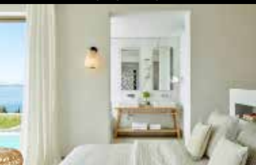
▼ EAGLES VILLAS ▼